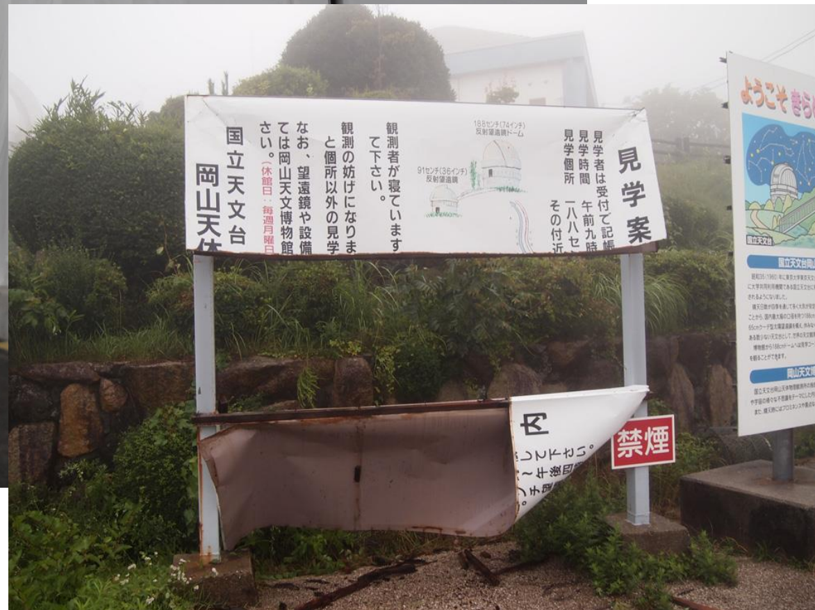
2015年7月16日と17日 台風11号(NANGKA) 倉敷に再上陸